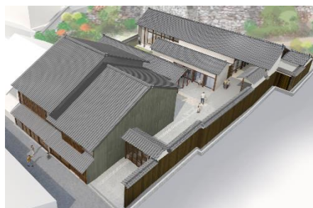
<町並み保存拠点施設の整備>