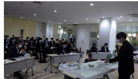
公開プレゼンテーションの様子