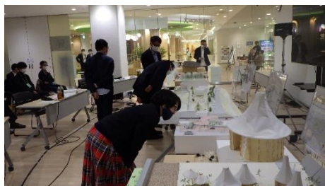
審査委員による選考の様子