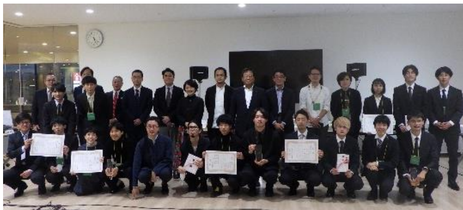
表彰式後の記念撮影