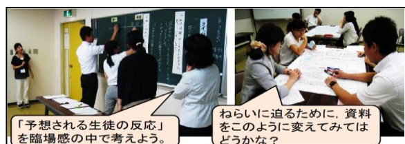
写真1 模擬授業のようす

5月に開催される総会で部会の方針や年間計画を確認した後，隣接する学校毎に3つのブロックに分かれて研究授業校を決定し，主題・教材の解釈と授業内容について協議を行っている。その後，授業者を中心に学習指導案を作成し，8月に開催される部会で部会員が生徒役になり模擬授業を行い，模擬授業後の協議で出た改善案を基に学習指導案を修正し，10月に各ブロックの研究授業校において研究授業を行っている。研究授業後の協議は，各ブロック共通の協議の柱を基に行い，指導主事等の助言者から指導助言を受け，次年度の研究につなげている。