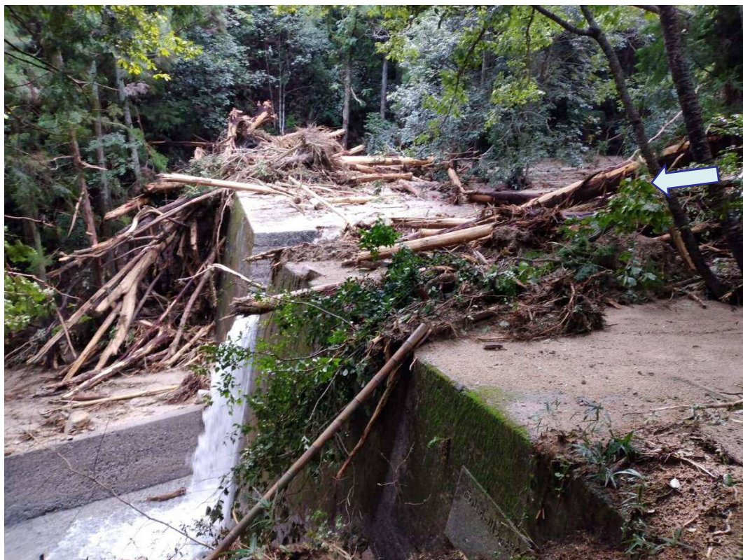
土石流発生前の状況 (H28.12)