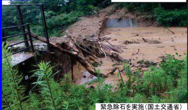
緊急除石を実施(国土交通省)