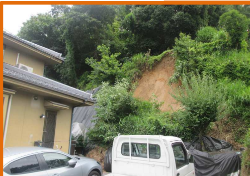
災害関連地域防災がけ崩れ対策事業を実施(府中町)