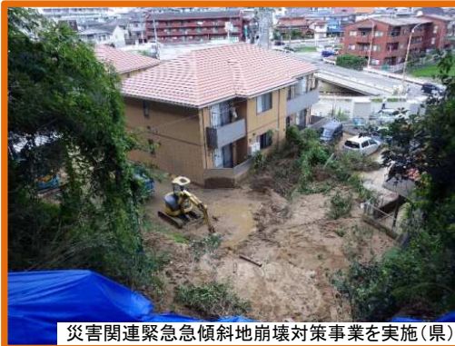
災害関連緊急急傾斜地崩壊対策事業を実施(県)