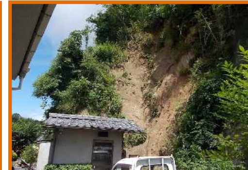
災害関連地域防災がけ崩れ対策事業を実施(江田島市)