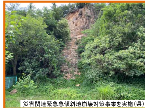
災害関連緊急急傾斜地崩壊対策事業を実施(県)