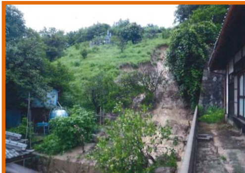
災害関連地域防災がけ崩れ対策事業を実施(江田島市)