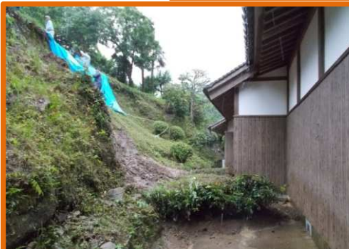
災害関連地域防災がけ崩れ対策事業を実施(江田島市)