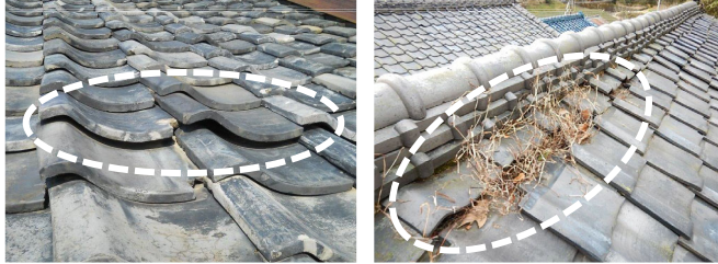
瓦に浮き上がりが生じている