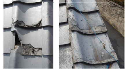
瓦が著しく破損している例