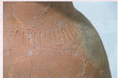
弥生土器壺の肩部の刺突文

広島県の弥生土器は、弥生時代後期では、南部と北部で異なりますし、南部でも東と西で大きく形が違ってきます。浄安寺遺跡のような西の土器は、三原市本郷町辺りまで出土しますので、弥生時代後期の土器の境目は三原市辺りにありそうです。