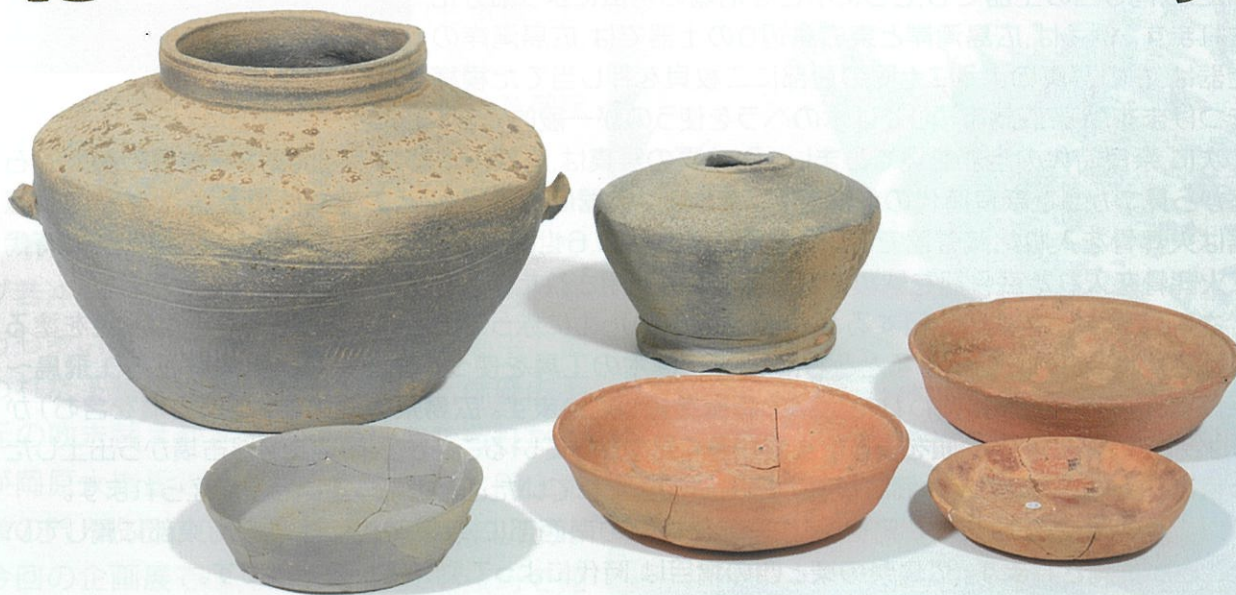
陣開第3号古墳(三原市)出土 土師器・須恵器(広島県立埋蔵文化財センター蔵)

山陽自動車道は、山陽地方を東西に貫く高速道路で、兵庫県神戸市北区を起点に、岡山県、広島県を通り、山口県山口市(山口JC)へ至る高速道路です。この山陽自動車道建設に当たっては、事業地内から数多くの遺跡が確認されており、広島県内で工事に先立って発掘調査が行われた遺跡は60か所にのぼります。それらの遺跡の中で、最初に発掘調査されたのは福山市春日町の平松1号遺跡でした。時期は昭和56年(1981)1月。今からちょうど40年前です。