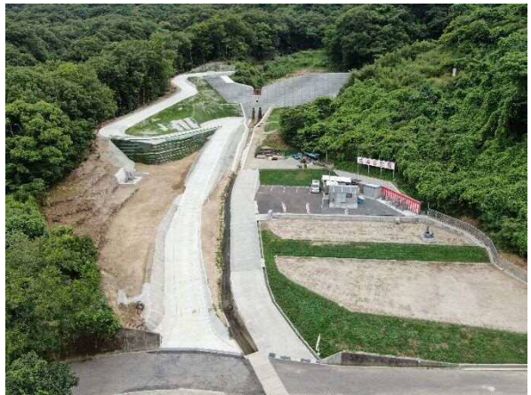
工事完了（令和3年7月15日）

設計：株式会社荒谷建設コンサルタント 施工：山陽工業株式会社 発注：西部建設事務所呉支所