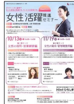
セミナー募集チラシ