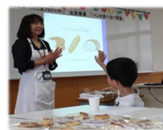
企業による出前講座