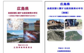
広島県自然災害に関する防災教育の手引き