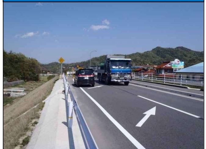
【整備前の状況(終点側)】