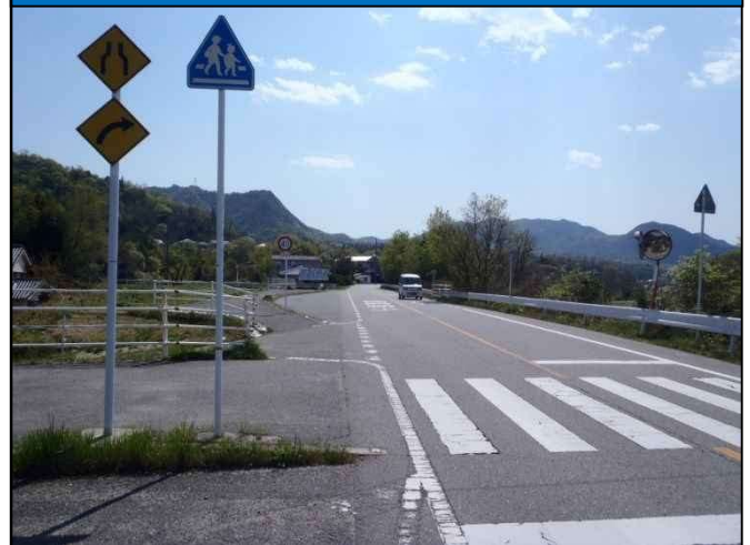
【整備前の状況(起点側)】