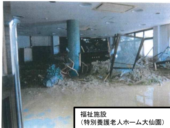
福祉施設 （特別養護老人ホーム大仙園）