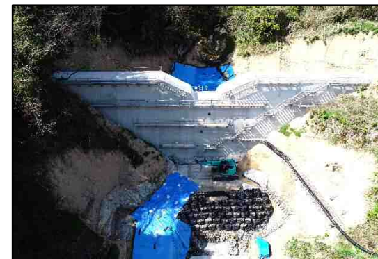
工事完了（令和3年3月25日）