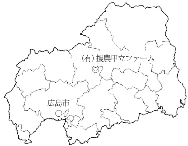
図1 広島県における(有)援農甲立ファームの位置

調査対象とした有限会社 援農甲立ファーム（以下、援農）は、2002年に広島県安芸高田市甲田町上甲立に設