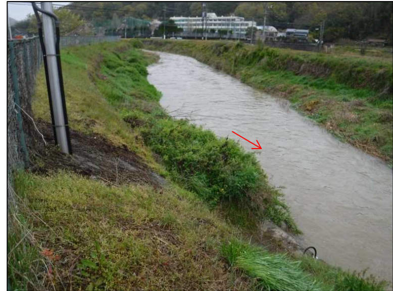
②工事中(令和3年2月撮影)