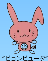
“ピョンピューター”

https://www.pref.hiroshima.lg.jp/site/kyouiku12/ict-katuyou-movie.html