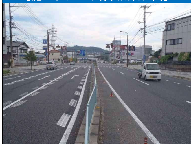
【施工状況：4車線供用済区間】