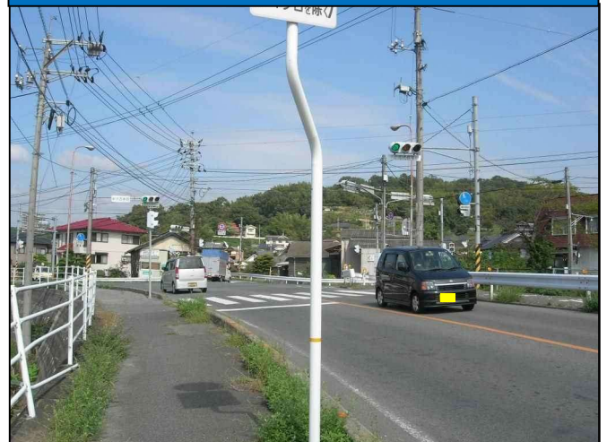
【現道の状況(新池五差路)】