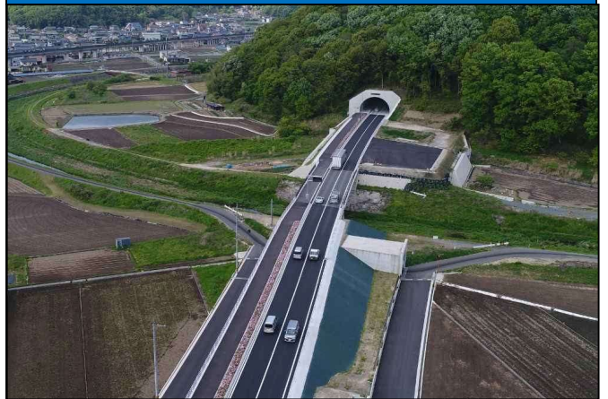
【施工状況(区間②完成状況)】

事業箇所：広島県福山市 神辺町下御領～上御領 事業延長：3.8km 事業内容：バイパス整備 道路規格：4種1級 設計速度：60km/h 幅員：25.0m(4車線) 完成：平成30年度(区間②)