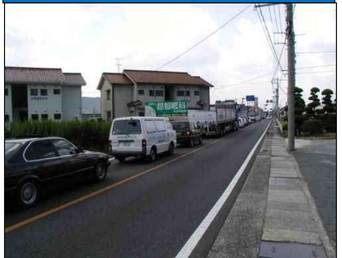
【現道状況(国分寺前交差点付近)】