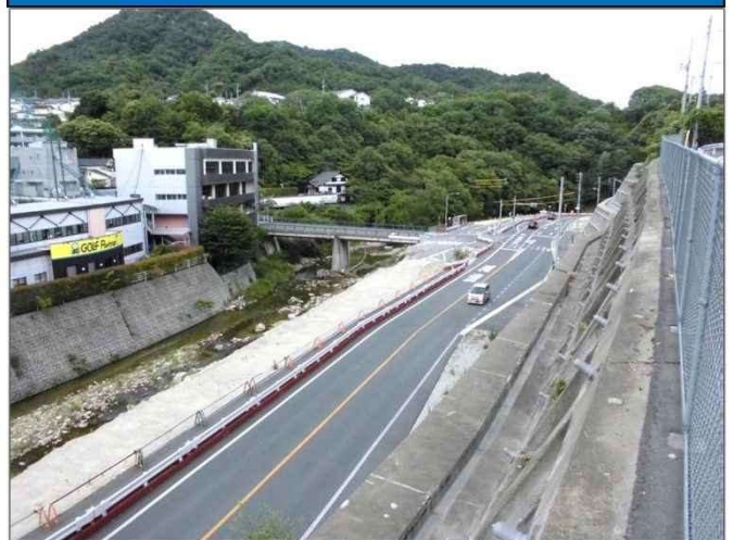
【施工状況(焼山此原町側)】