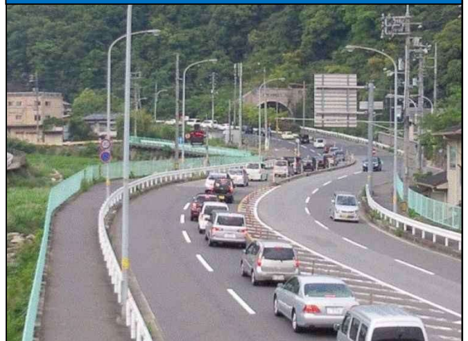
【現道の状況(上二河町側)】