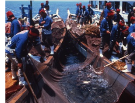
<鞆の浦鯛しばり網漁法>