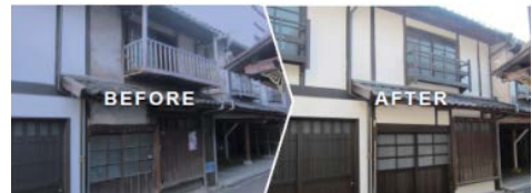
<伝統的建造物の保存修理の例>