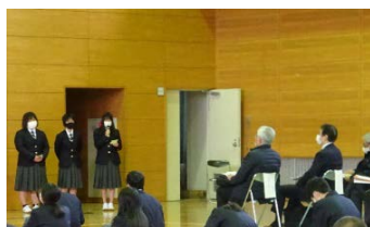
事業所の方々も招待しました