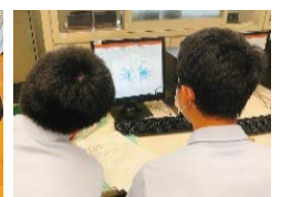
ICTを活用して動画を作成