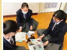
冊子の構成を検討