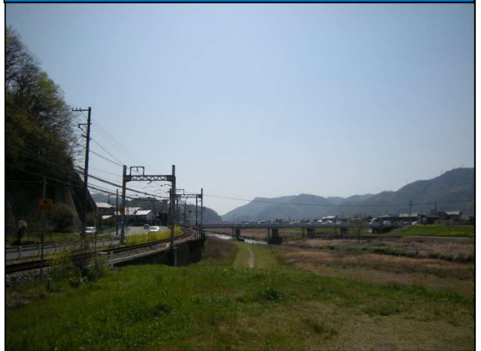
【令和2年度事業内容】