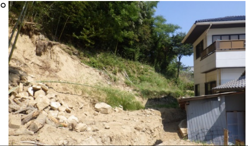
斜面崩壊・被災状況（H30年7月）