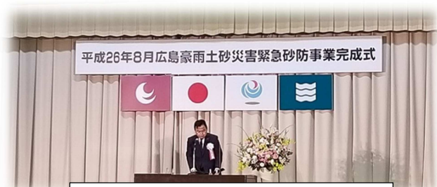
主催者挨拶（赤羽国土交通大臣）