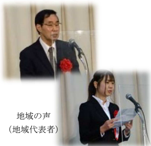
地域の声 （地域代表者）