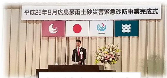
主催者挨拶（湯崎知事）