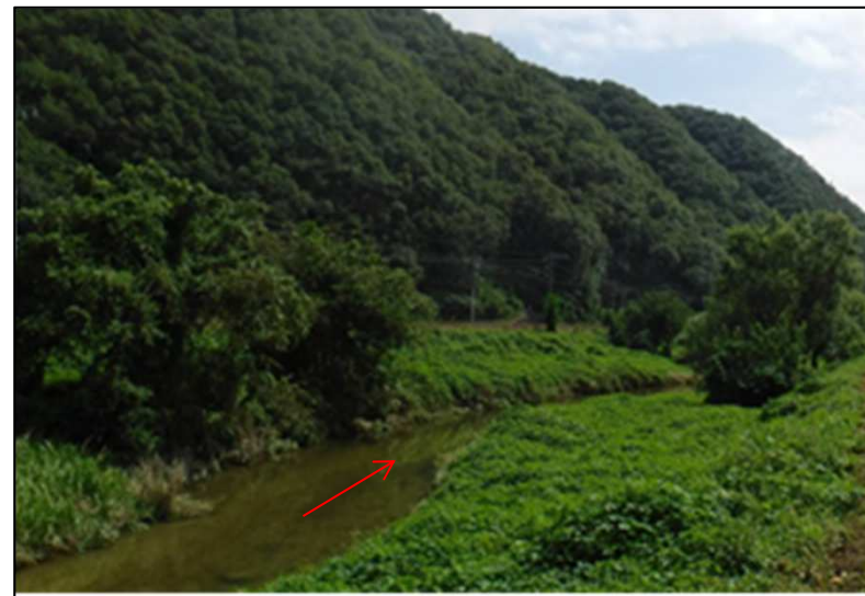
①工事完了(令和2年3月撮影)