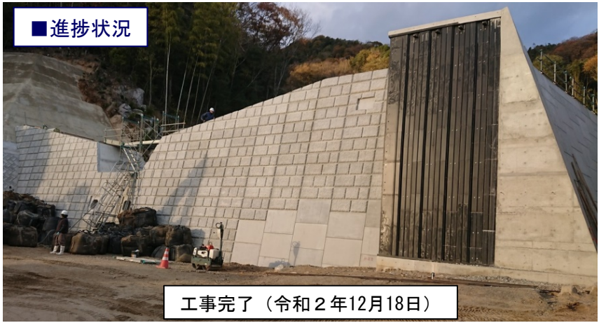
工事完了（令和2年12月18日）