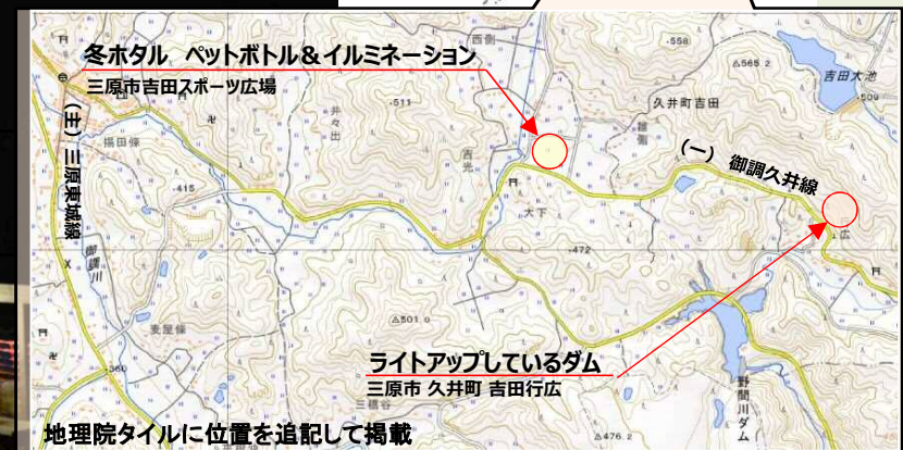
冬ホタル ペットボトル&イルミネーション