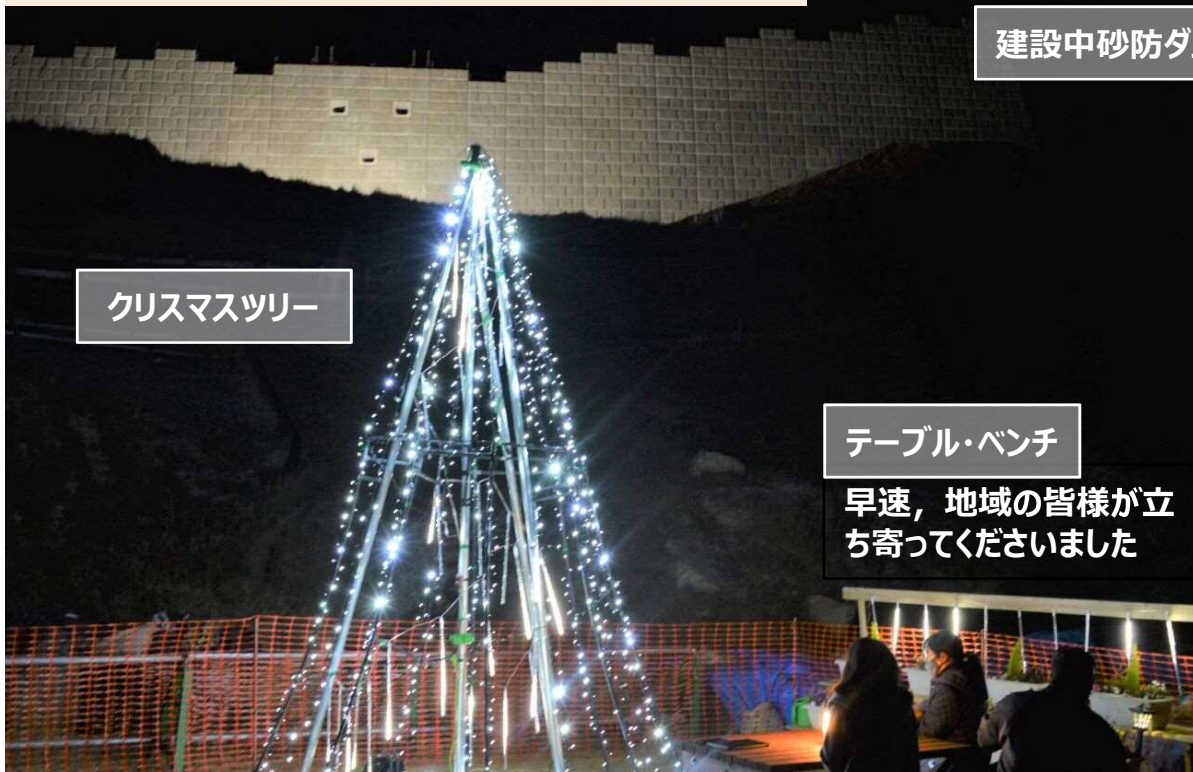
クリスマスツリー

開催期間：令和2年12月1日～令和3年1月2日 17:30～22:00 開催場所：三原市 吉田スポーツ広場