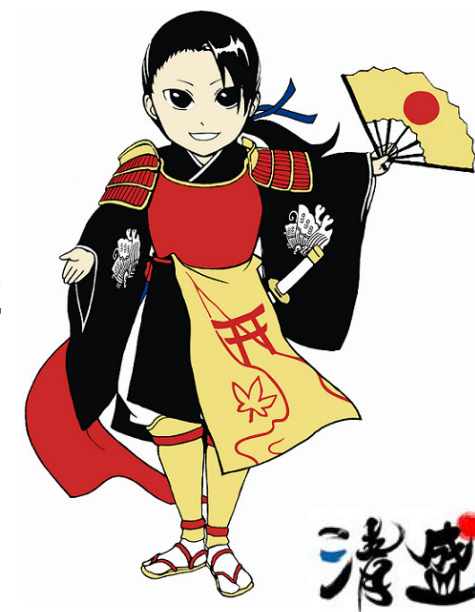
大河ドラマ「平清盛」広島県推進協議会 キャラクター「ひろしま清盛」