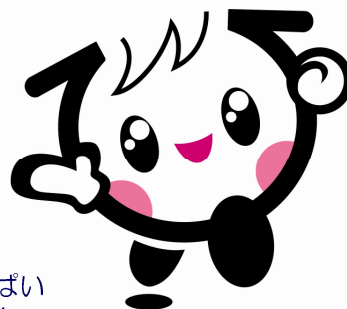
広島県の子ども元気いっぱい キャラクター「イクちゃん」