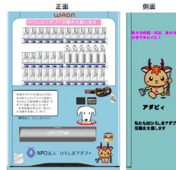
※ アダプト支援自販機イメージ