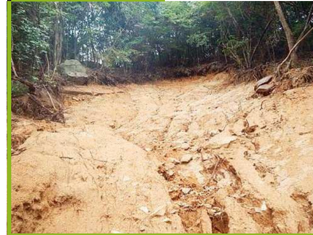
源頭部(土砂発生源)