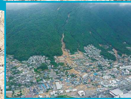
広島市安佐南区八木地区【死者 52 名】