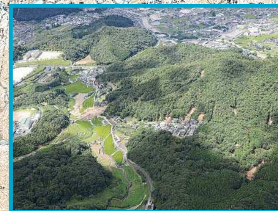
広島市安佐北区可部町地区【死者 1 名】