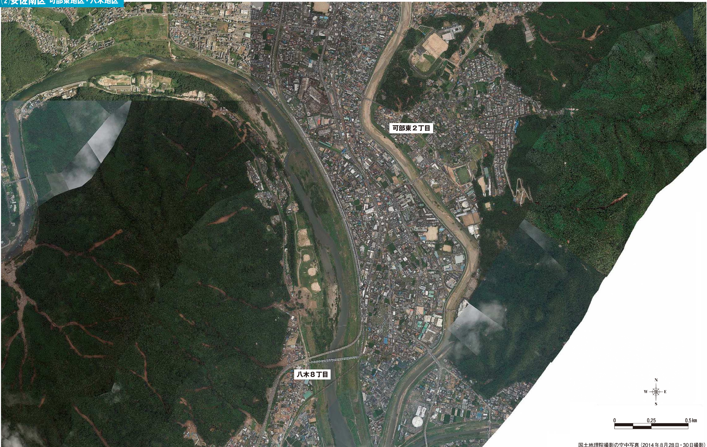
国土地理院撮影の空中写真 (2014年8月28日・30日撮影)