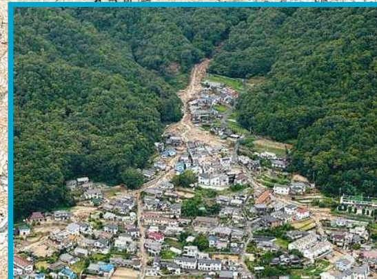
広島市安佐南区緑井地区【死者 14 名】