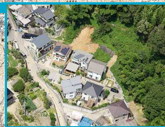
広島市安佐南区山本地区【死者 2 名】