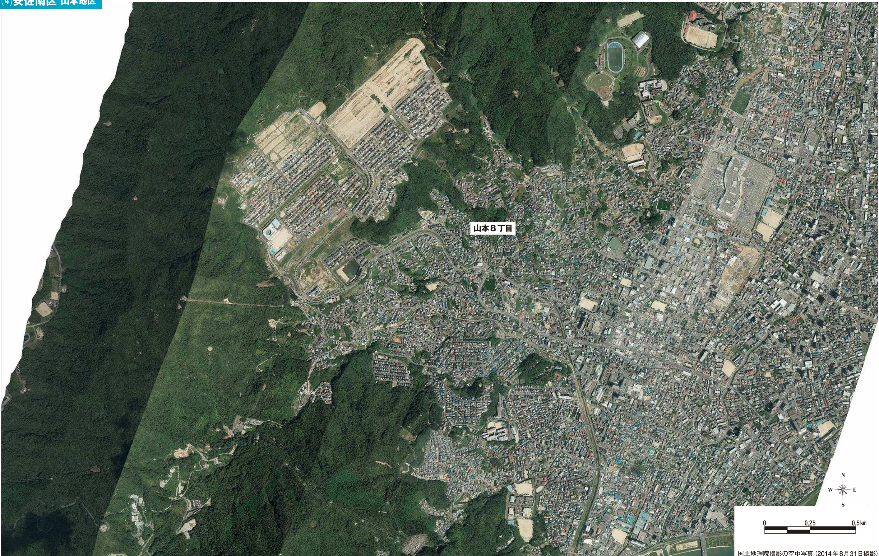
国土地理院撮影の空中写真(2014年8月31日撮影)