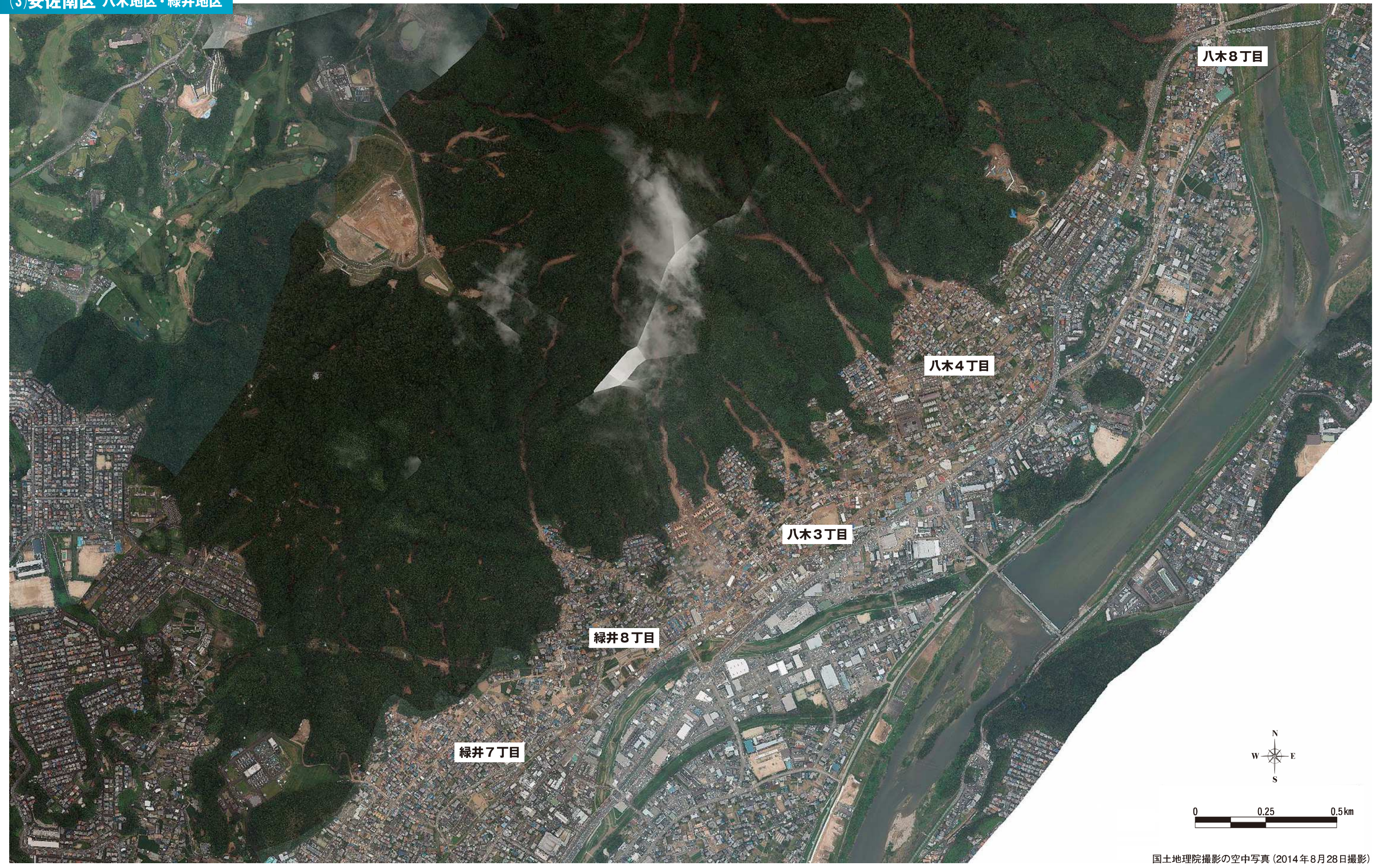
空中写真(2014年8月28日撮影)