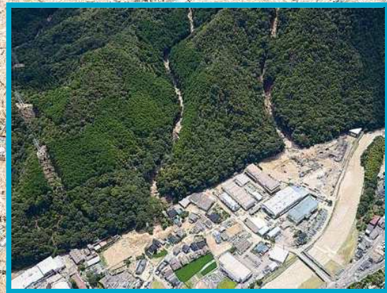
広島市安佐北区三入南地区【死者 1 名*】