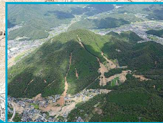
広島市安佐北区可部東地区【死者 4 名】