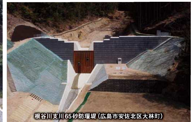
根谷川支川65砂防堰堤(広島市安佐北区大林町)