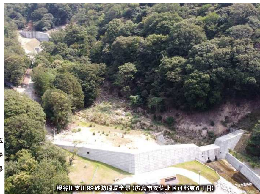
根谷川支川99砂防堰堤全景(広島市安佐北区可部東6丁目)