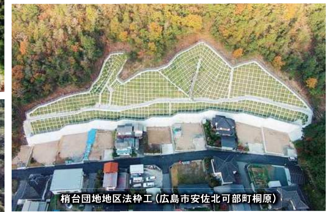
梢台団地地区法枠工(広島市安佐北区可部町桐原)