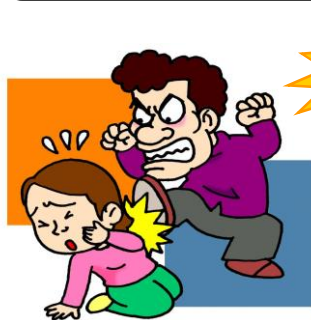
子どもの目の前で夫婦間暴力を行った

子どものいる家庭でのDVは、子どもが暴力に巻き込まれたり、直接的な暴力を受けたり、あるいは、暴力を目撃することにより、子どもの心身に影響が現れることがあります。