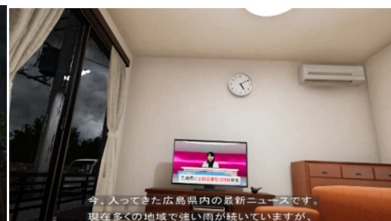
(大雨特別警報発令場面)