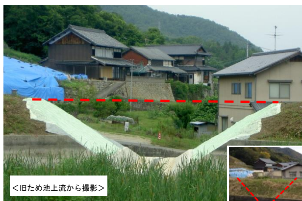
ため池の廃止工事状況

また、今後も年 100 箇所程度の廃止工事を予定していることから、ため池や仮設道用地の権利関係が円滑に整理できるよう、所有者不明の土地問題の解決に向けた制度化について、国に要請している。