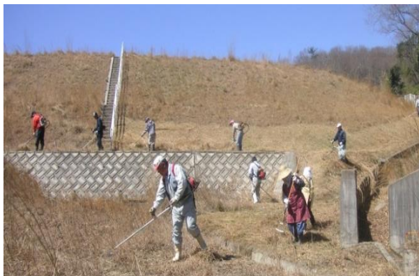
管理者等によるため池の管理状況

管理者等に対して、出水期前に草刈等を行い、施設の老朽度などを確認した上で、必要に応じて水位を下げるなどの適切な管理を要請し、安全確保を徹底している。併せて、老朽化が進行し対策が必要なため池で、地元負担金などの調整が済んだ箇所について、年 30 箇所程度の補強工事を進めている。