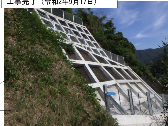
工事完了（令和2年9月17日）