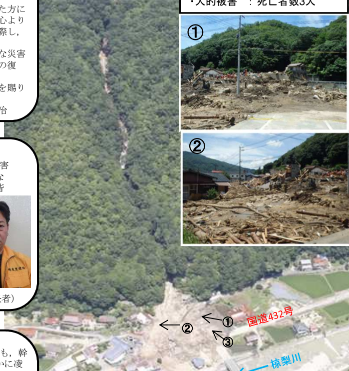
平成30年7月 被災状況