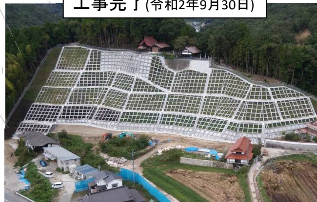
工事完了(令和2年9月30日)