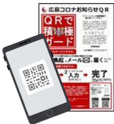
①QRコードの読み取り