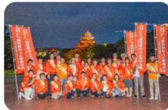
昨年度の記念写真