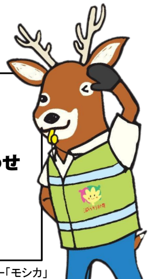
広島県民総ぐるみ運動 マスコットキャラクター「モシカ」

平成28年～令和2年 「めざそう！ 安全・安心・日本一」 ひろしまアクション・プラン