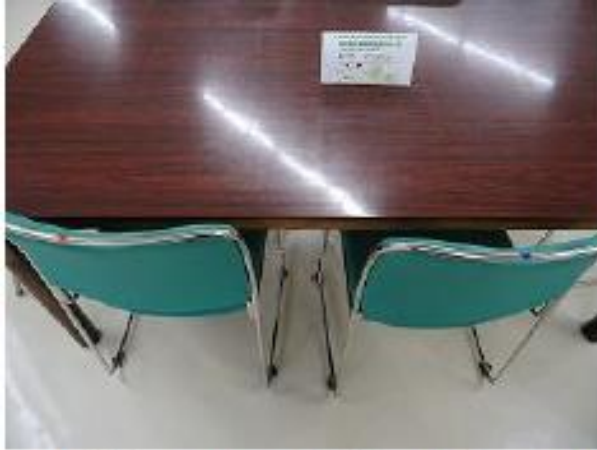
▲椅子の背に目印の色シール