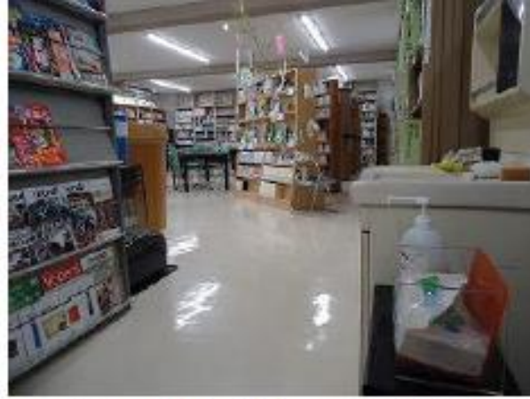
▲入口洗面台に手指消毒液と石鹸、ペーパータオルを常備