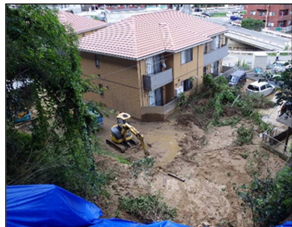
畑賀 1 丁目 2 地区 (広島市安芸区)