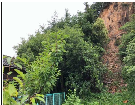
引野町 626 地区 (福山市)