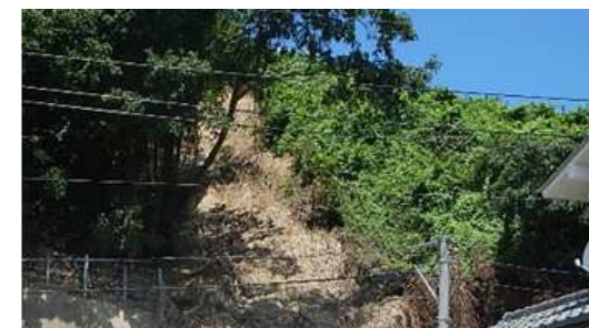
工事完了（令和2年7月31日）