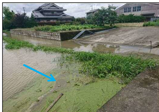
西谷川 (福山市駅家町)