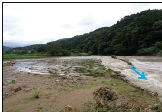
三篠川 (広島市安佐北区白木町井原)