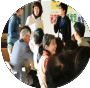
地域公開参観日で

子供の発達段階やそれに伴う親の悩み・不安などに応じて様々なワークシートの中から学習していただくことができます。