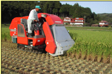
飼料イネ専用収穫機で収穫, サイレージ調製