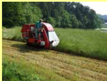
飼料イネ専用収穫機は、イタリアンライグラス、エンバクも収穫可能