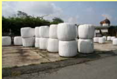
ラップサイロとして貯蔵