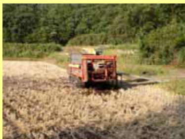
不耕起播種による省力栽培 (播種直後、堆肥散布) (耕起栽培も可能)