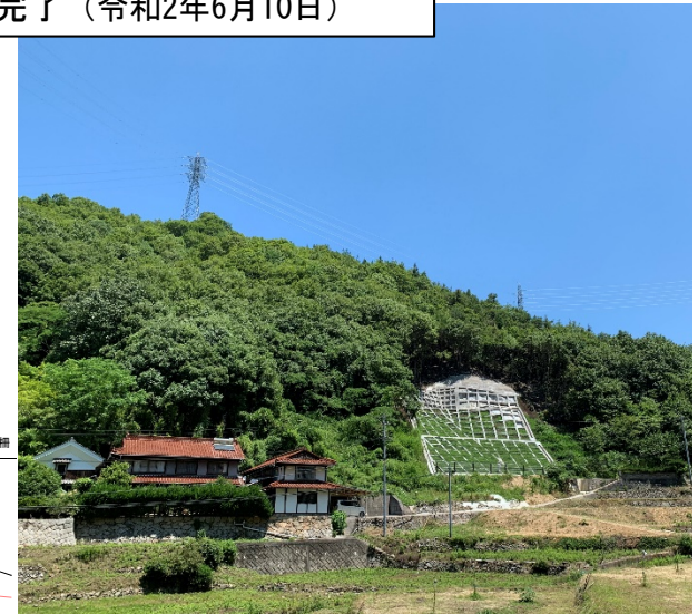
工事完了（令和2年6月10日）