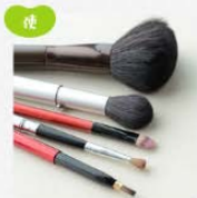
住宅用品・家具・工芸品