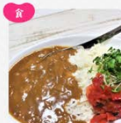
調味料・レトルト食品