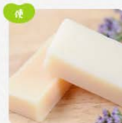
日用品・雑貨・その他